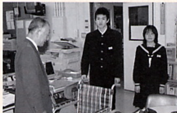
▲平成19年5月30日 湊中学校様より車椅子寄贈