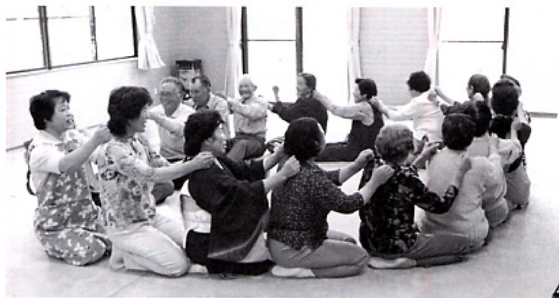
▲スキンシップでつながりを深める参加者(昨年7月)

今年度も「七夕の集い」をメインに、昨年以上に地域に貢献し喜ばれる活動を予定しています。みなさんのご参加をお待ちしています。