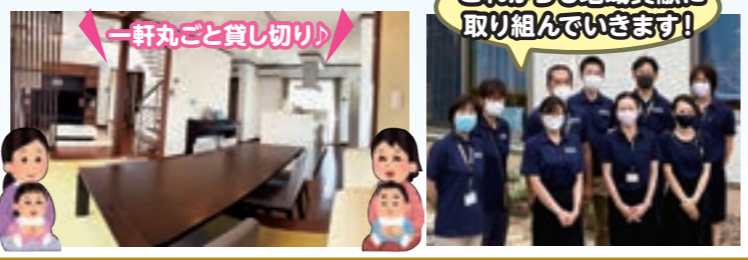
一軒丸ごと貸し切り♪

利用料: 1日あたり(10時から16時) 1,500円 詳細については、牡鹿観光 TEL 94-8311までお問い合わせください。