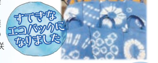
すてきなエコバックになりました