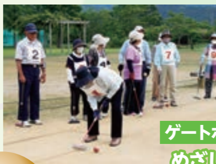
ゲートボール めざして、1ゲート通過!