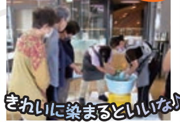
きれいに染まるといいな!