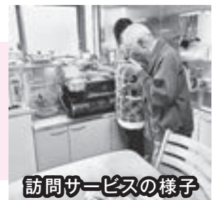
訪問サービスの様子

介護保険、障害福祉サービスでは対応できない、庭の草取りや嗜好品の買い物などを支援しています。各種制度が使えず、生活に困っている方々への支援をしていくことが法人として必要であるとの認識により始まった事業です。