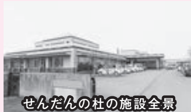
せんだんの杜の施設全景

本来は運営委員会の設置の必要性はありませんが、地域の有識者の方々との情報交換、情報共有を目的に開催しています。地域と施設の垣根を取り除くことで、地域の方と入所者の方の交流が図られるようになります。入所者の方にとっては、夏祭りは施設主催よりも地域の夏祭りに参加した方が生き生きしています。