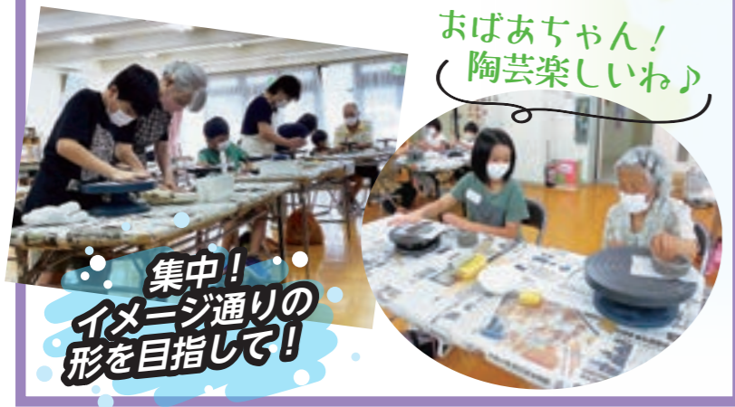
おばあちゃん! 陶芸楽しいね♪

午前の部と午後の部で合計43名が参加し、「コップを作ってお父さんにあげる!」「豆腐が好きだから豆腐に合う皿を作りたい!」といったそれぞれの思いを込め、祖父母と一緒に楽しみながら制作しました。帰り際には、「また来年も参加したい」という声も聞かれ、笑顔のあふれた一日になりました。