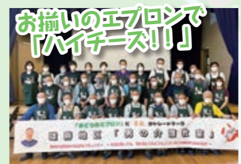
お揃いのエプロンで「ハイチーズ!!」

「久しぶりだなあ〜」「変わんねな〜」、そんな挨拶を交わし、会場に集まって来るエプロンを身にまとった男性陣。なんの会場かというところ、そこは「雄勝地区 男の介護教室」。みなさんが身に付けている「みどり色」に「男技」と書かれたエプロンは「男の介護教室」のトレードマーク。